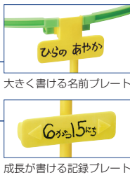
成長が書ける記録プレート