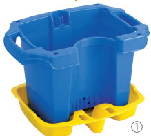
① 植木鉢C型(うげざら付)